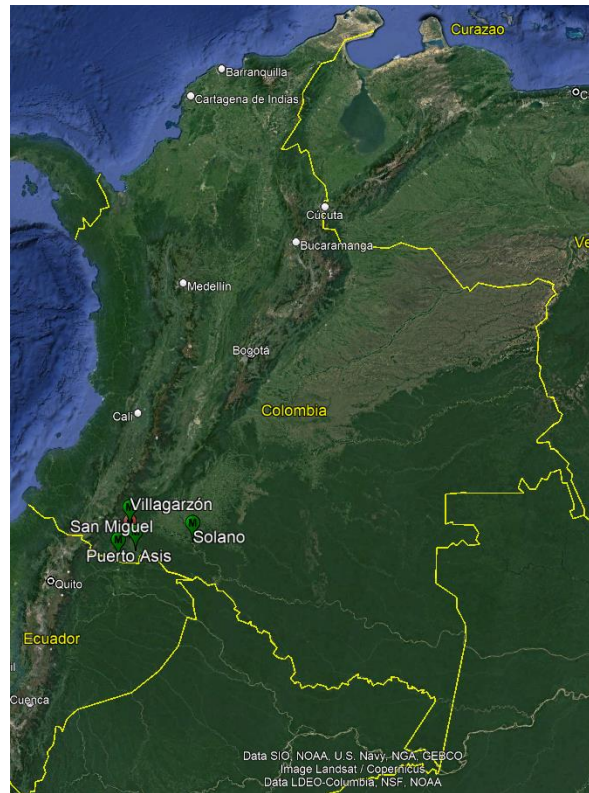
Ilustración 1. Localización de lote 1, municipios de Villa garzón, Puerto asís, San Miguel y Solano son municipios de los departamentos del Putumayo y Caquetá. (en Colombia.)

LOTE 1 conformado por los municipios de Villa garzón, Puerto asís, San Miguel y Solano son municipios de los departamentos del Putumayo y Caquetá, dichos municipios se ubican en las siguientes coordenadas: Villa garzón (1° 1'42.57"N; 76°37'2.74"O), Puerto asís ( 0°29'54.61"N; 76°29'51.94"O), San Miguel (0°19'48.07"N; 76°52'34.90"O) y Solano (0°41'56.95"N; 75°15'12.80"O). fueron fundados en las décadas de los 80 y 90 y basan su economía principalmente en la Agricultura, lo que permitió un desarrolló considerable entre los años 2000 y la actualidad.